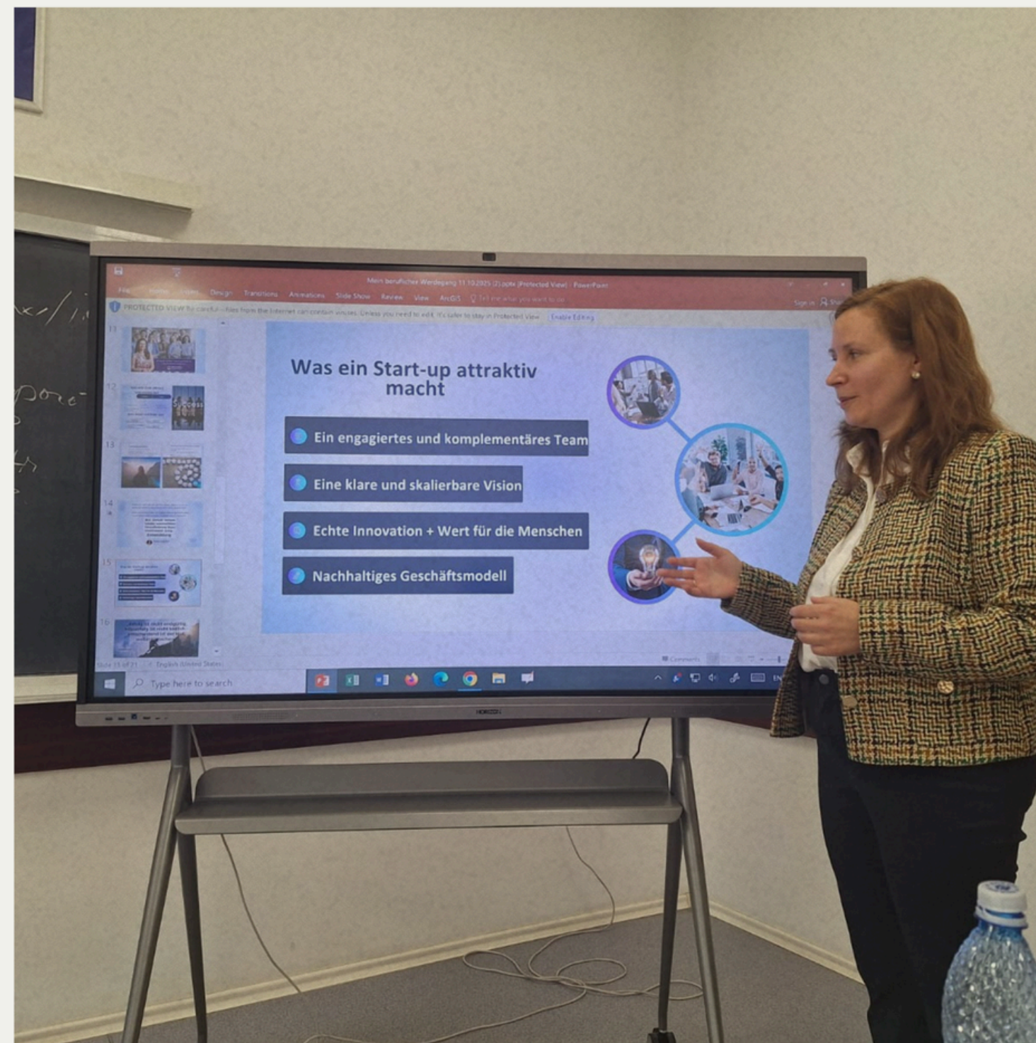
Prezentare Master ASE, secția de limbă germană în parteneriat cu Universitatea din Wuppertal, Germania