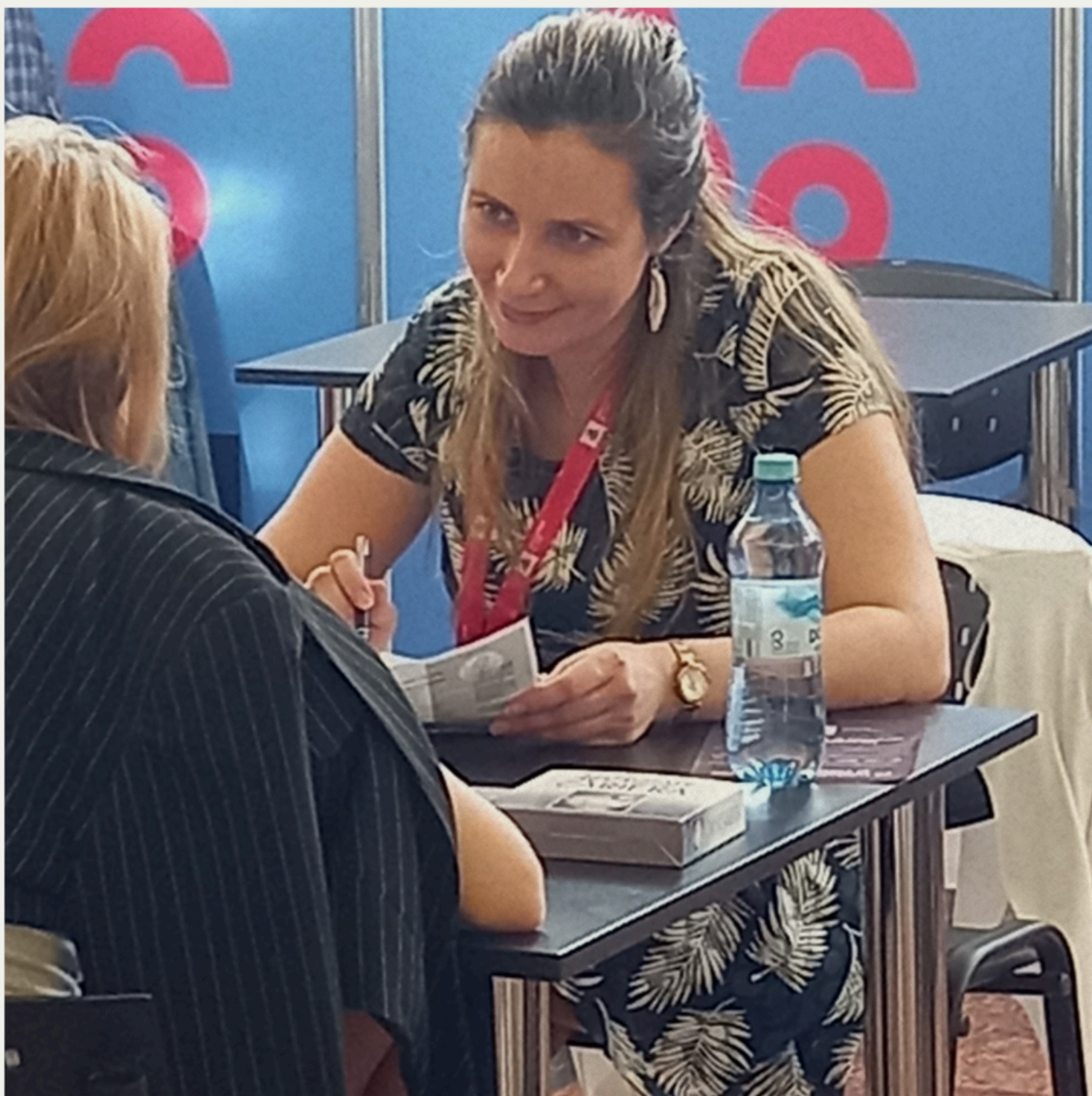
Coaching de carieră, Târgul de Carieră „Angajatori de Top” București 2022 - 2024