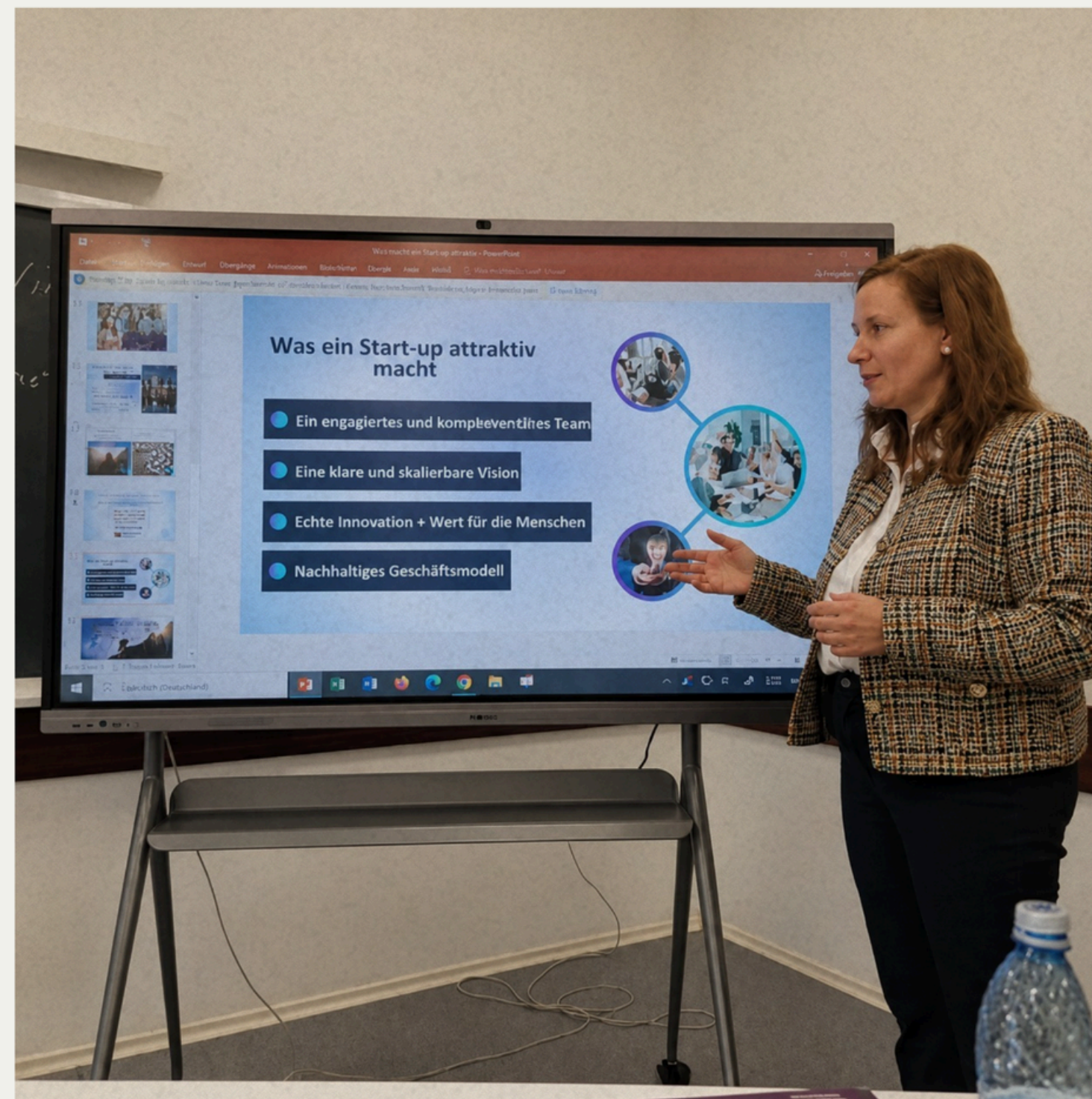
Prezentare Master ASE, secția de limbă germană în parteneriat cu Universitatea din Wuppertal, Germania